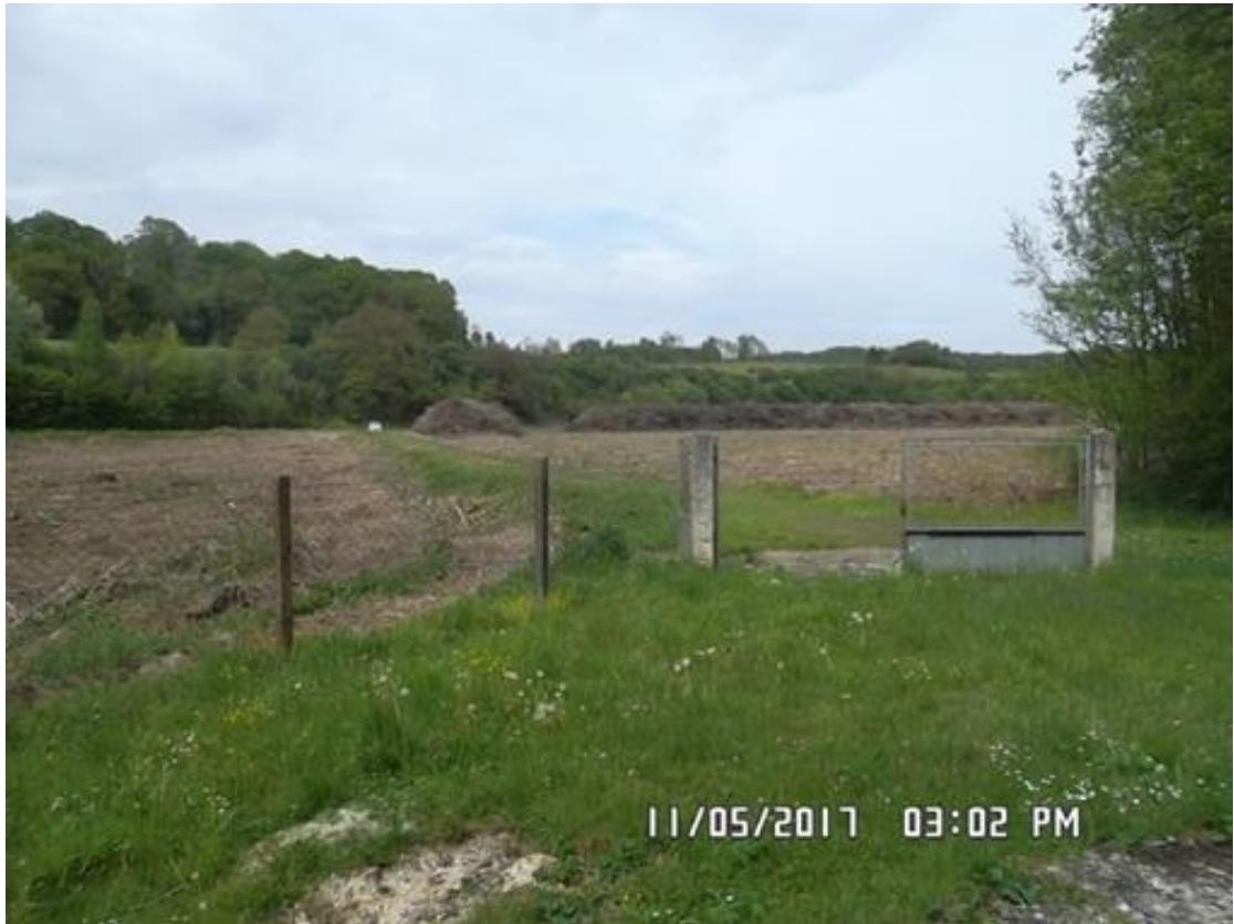
Figure 5 : Chemin d'accès au captage