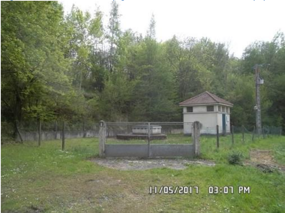
Figure 4 : Portail d'accès à l'enceinte clôturée