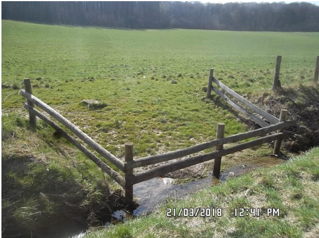
Figure 6 : Abreuvoir (n° 1 sur la carte de localisation)