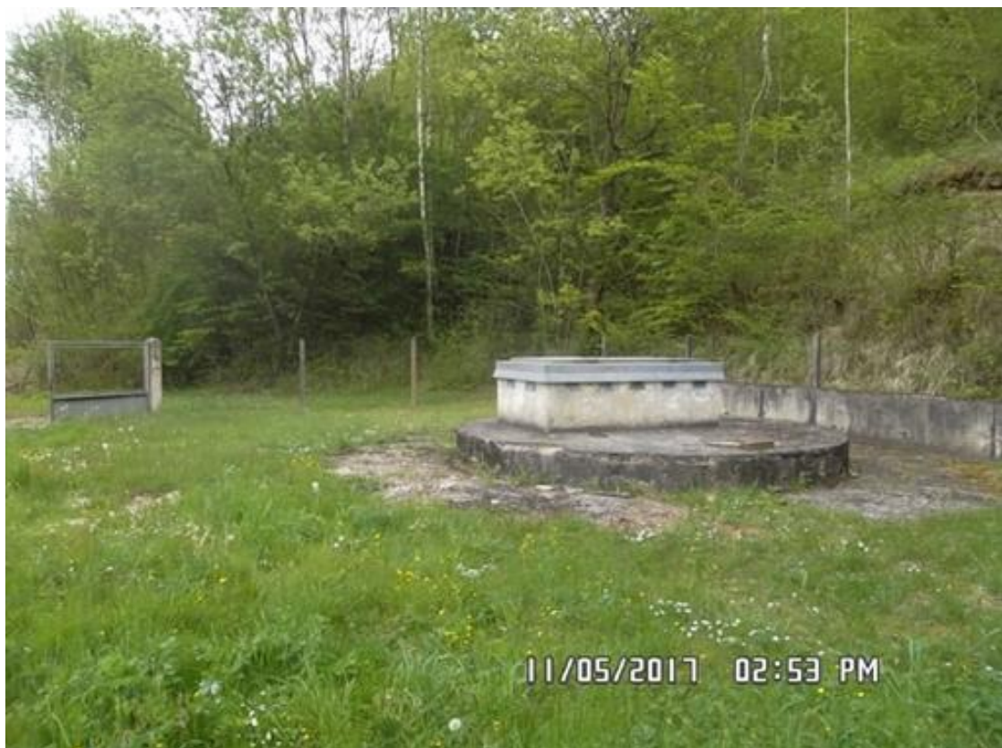
Figure 2 : Vue externe de la chambre de captage