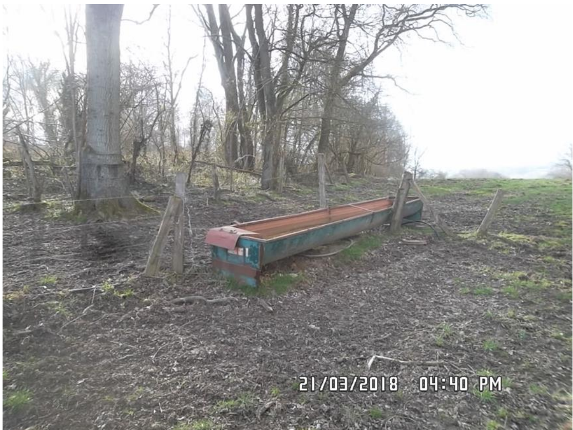
Figure 13 : Abreuvoir (n° 8 sur la carte de localisation)