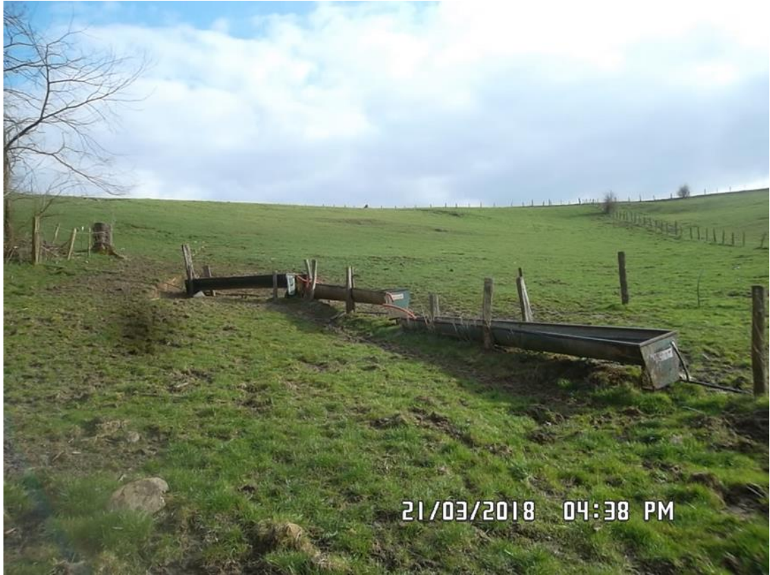
Figure 12 : Trois abreuvoirs (n°7 sur la carte de localisation)