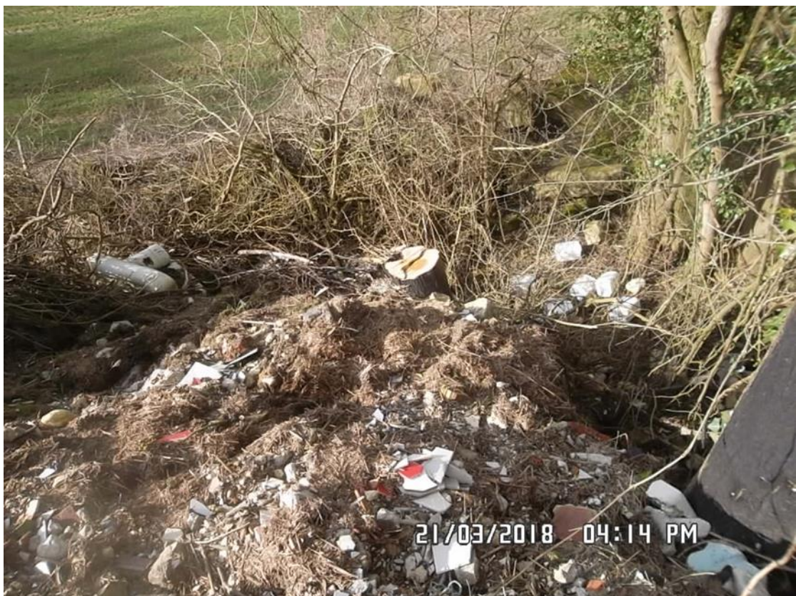
Figure 9 : Déchets (n°4 sur la carte de localisation)