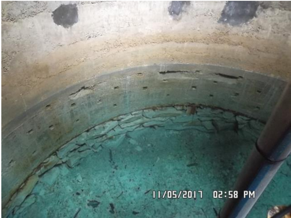
Figure 3 : Vue interne de la chambre de captage et observation de l'arrivée des barbacanes sur la périphérie