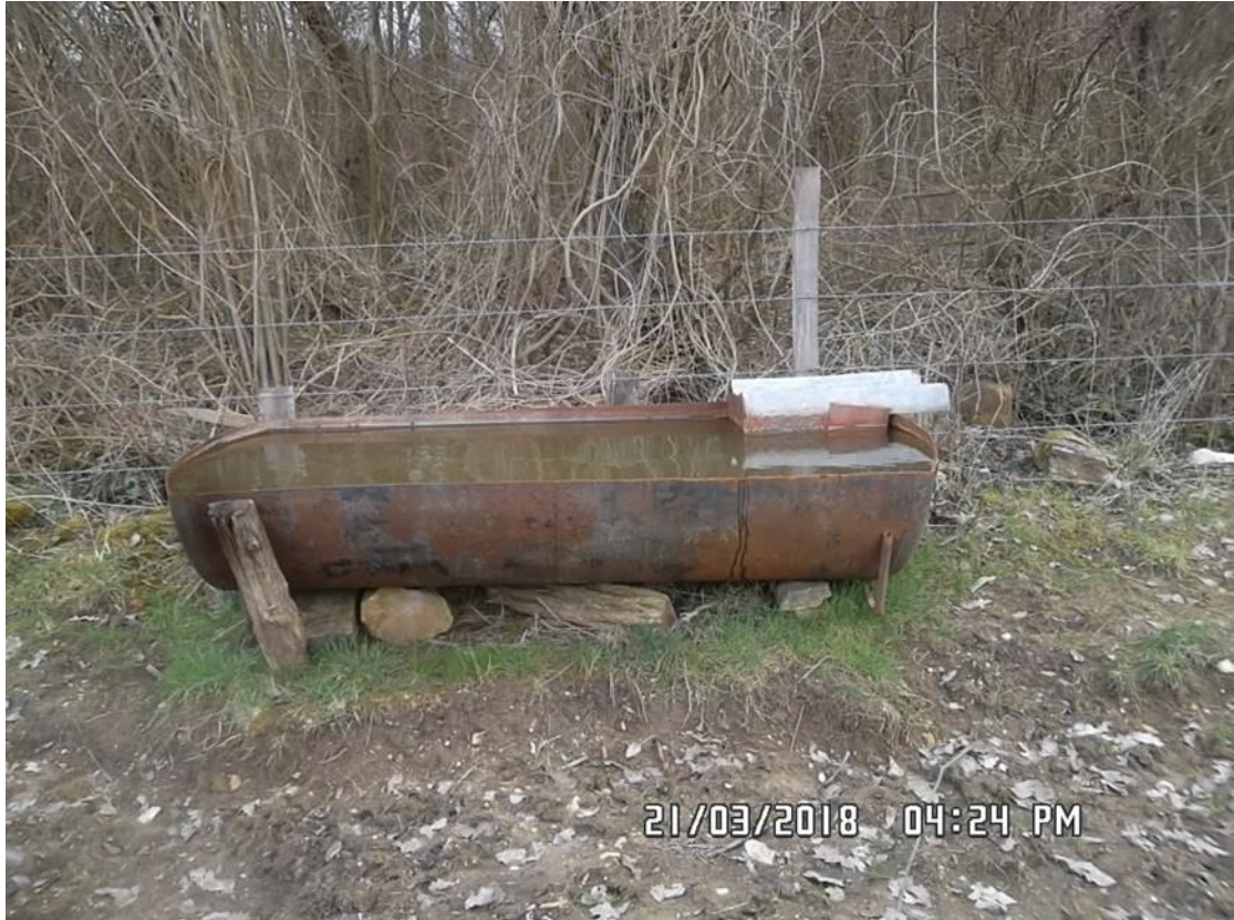
Figure 10 : Abreuvoir (n° 5 sur la carte de localisation)