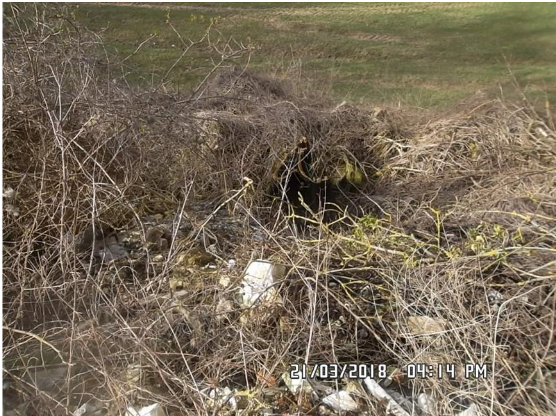
Figure 8 : Déchets (n°3 sur la carte de localisation)