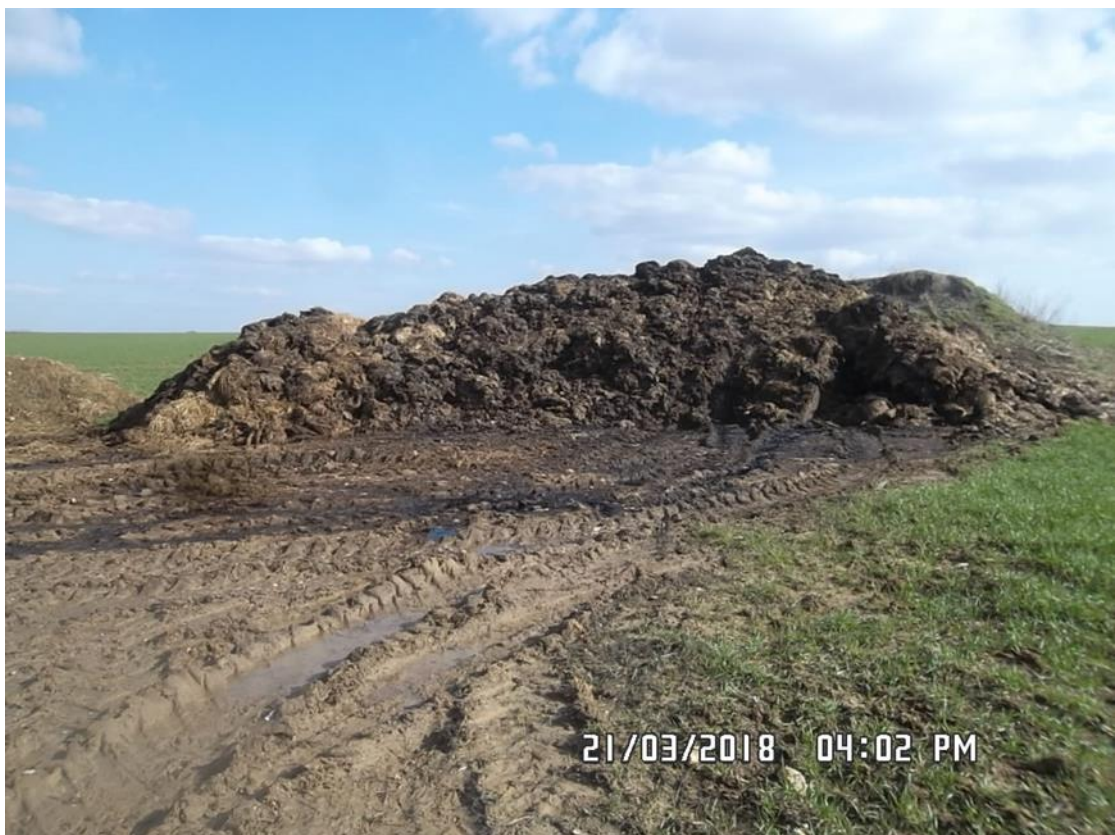
Figure 7 : Fumier (n°2 sur la carte de localisation)