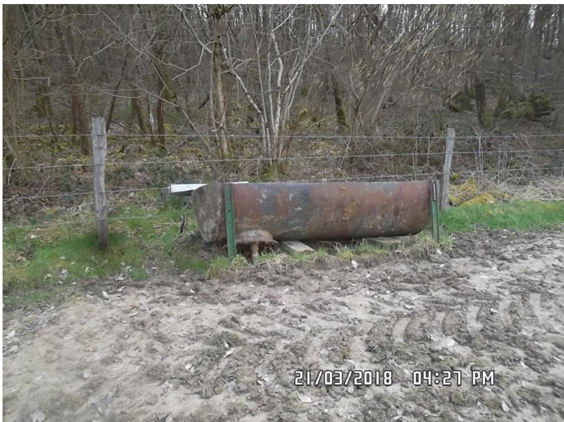
Figure 11 : Abreuvoir (n°6 sur la carte de localisation)