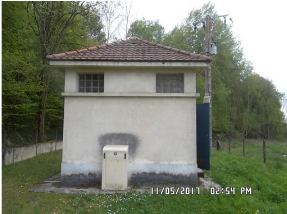
Figure 1 : Bâtiment du captage de la Fontaine des Biches